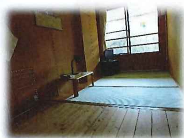
リーダー室<2人部屋>