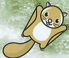
むかばき青少年自然の家 オリジナルキャラクター 「ムーン」

「祖母・傾・大崩ユネスコエコパーク」 の緩衝地域として、行滕山も登録されました。