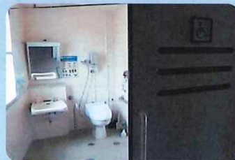
〈車いす利用トイレ〉