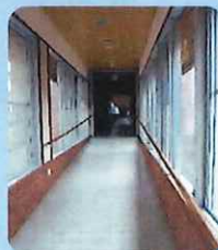
〈手すり付きスロープ〉

施設内外はスロープや風呂付き個室が2部屋あります。食事、宿泊、入浴の利便性が確保でき、充実した研修が可能となります。