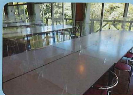
〈パーティションを設置し対面での食事が可能に〉