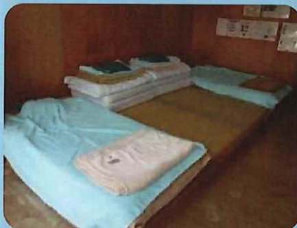
〈宿泊室内の利用人数の制限〉