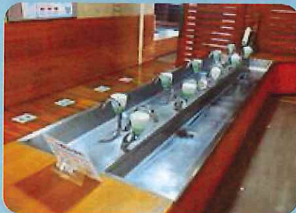
〈食堂手洗い場を自動水栓へ〉