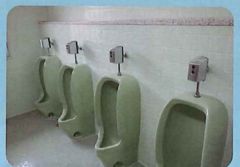
〈小便器を自動洗浄へ〉