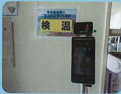
〈施設内に自動検温器の設置〉