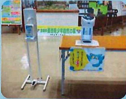
〈自動、足踏み式、噴出消毒液〉