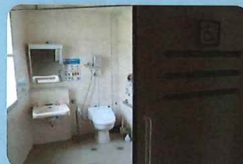
〈車いす利用トイレ〉