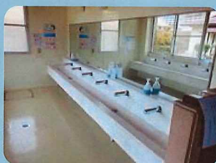
〈手洗い場を自動水栓へ〉