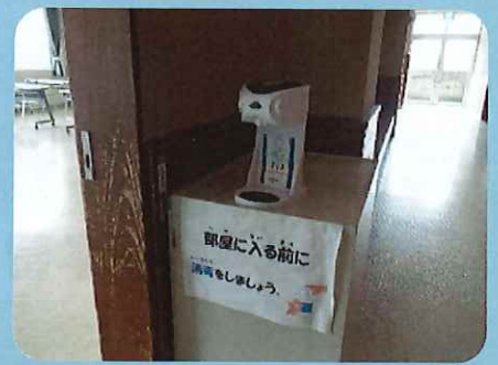
〈施設内に消毒液の設置〉