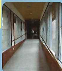
〈手すり付きスロープ〉

施設内外はスロープや風呂付き個室が2部屋あります。食事、宿泊、入浴の利便性が確保でき、充実した研修が可能となります。