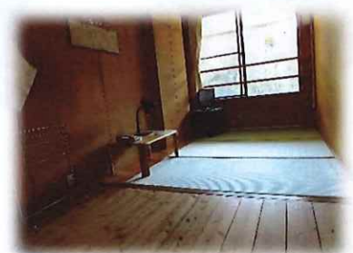
リーダー室<2人部屋(1人)>