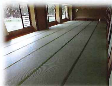
和室<30人部屋(18人) 中央で仕切可、15人部屋(9人)×2