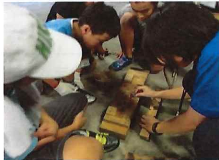
〈火おこし・野外炊飯〉