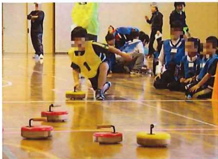
〈室内オリンピック〉