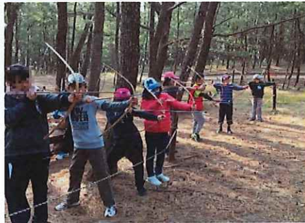
〈しおかせ追跡ハイキング〉