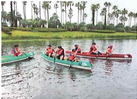
〈フィールドアスレチック〉