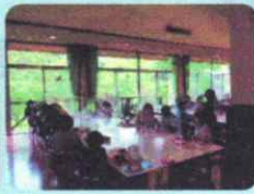
食堂にパーティションの設置