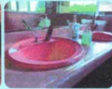
手洗い場を自動水栓化に改修