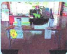
館内に消毒液の設置