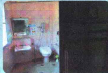
車いす利用トイレ