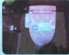
和式トイレをすべて洋式トイレへ