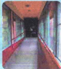
手すり付きスロープ

施設内外はスロープや風呂付き個室が2部屋あります。食事、宿泊、入浴の利便性が確保でき、充実した研修が可能となります。