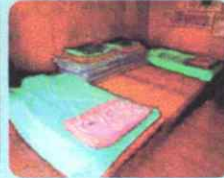
宿泊室内の利用人数の制限