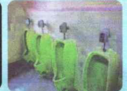
小便器を自動洗浄へ