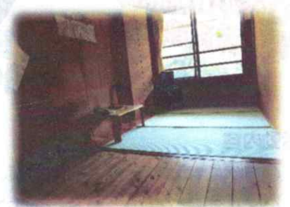
リーダー室<2人部屋(1人)>