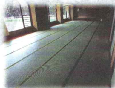
和室<30人部屋(18人) 中央で仕切可、15人部屋(9人)×2