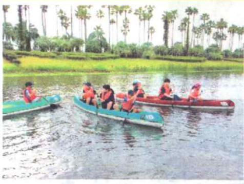
〈フィールドアスレチック〉