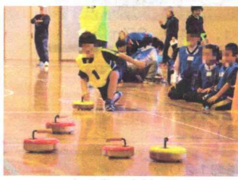
〈室内オリンピック〉