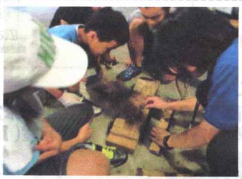
〈火おこし・野外炊飯〉