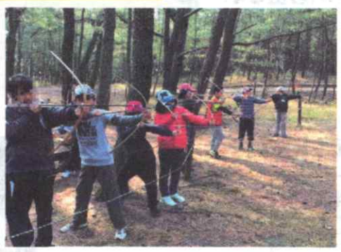
〈しおかせ追跡ハイキング〉