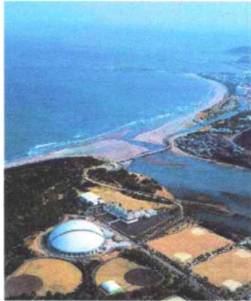
青島青少年自然の家